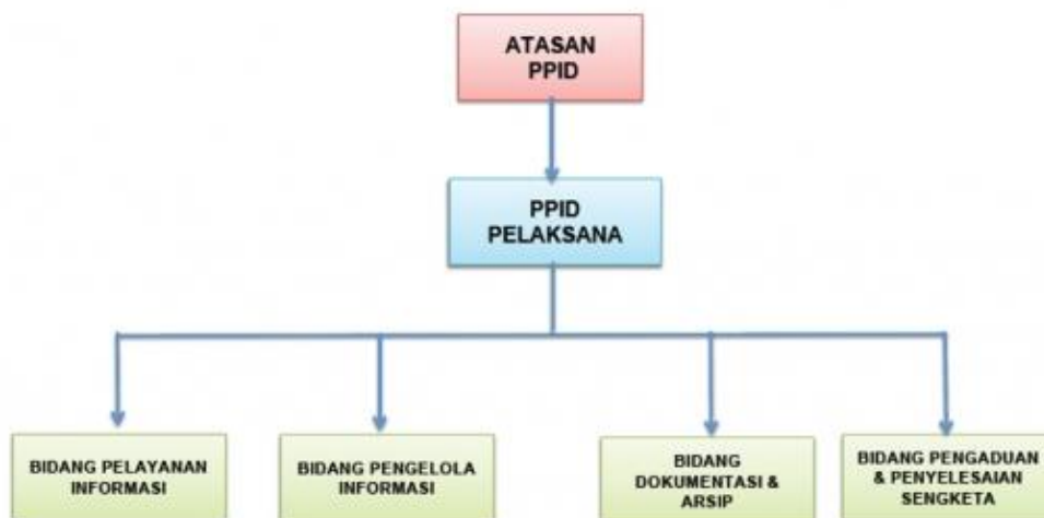
Gambar 1.1 Struktur layanan informasi dan dokumentasi pelaksana pada Dinas Kesehatan Aceh